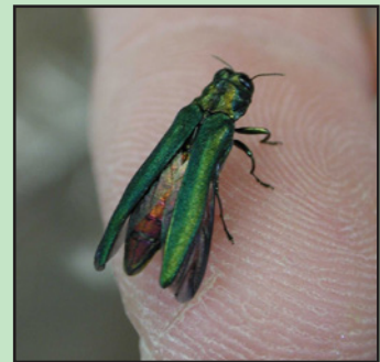
L'Agence canadienne d'inspection des aliments

Pour plus d'information du l'agrile du frêne, visitez le site Web de l'Agence canadienne d'inspection des aliments à http://www.inspection.gc.ca/vegetaux/protection-des-vegetaux/insectes/agrile-du-frene/fra/1337273882117/1337273975030 .