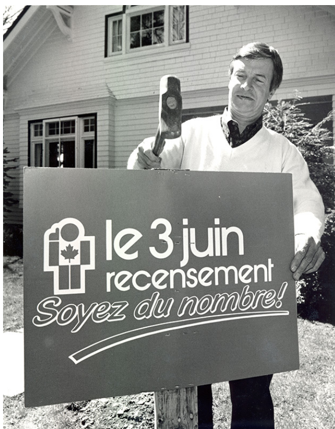
Recensement de 1986.