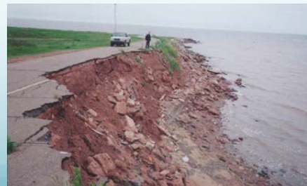
G. MacDougall / Ministère de l'Agriculture et des Forêts de l'Île-du-Prince-Édouard