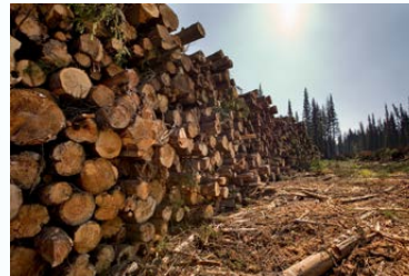
L. Hislop / GRID-Arendal